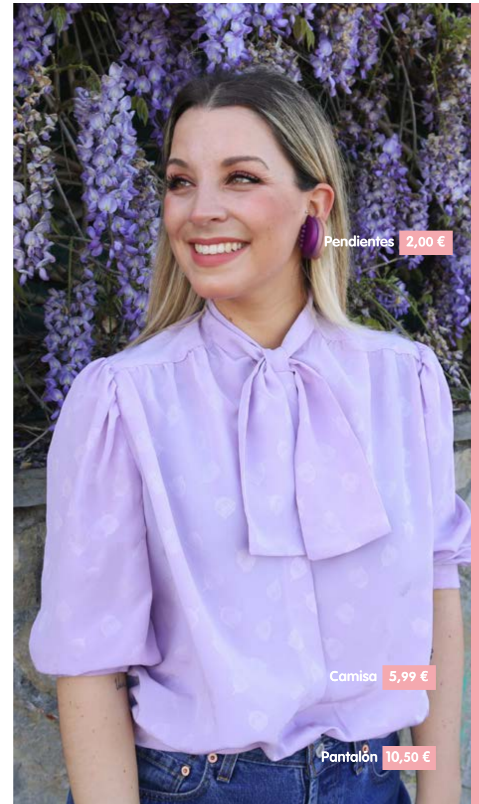
Pendientes 2,00 €

La blogger @san.seti posa para nuestra revista con prendas de Koopera Store. #modasostenible.