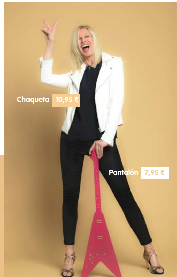
Chaqueta 10,95 €

Nos entrega unas prendas que quiere donar, y nos ha sorprendido gratamente que haya escogido prendas con cierto componente sentimental.