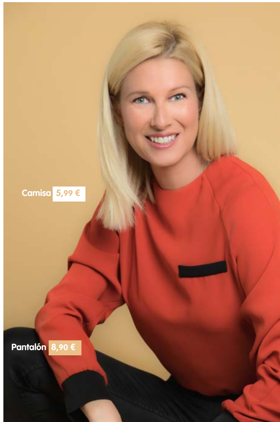
Camisa 5,99 €